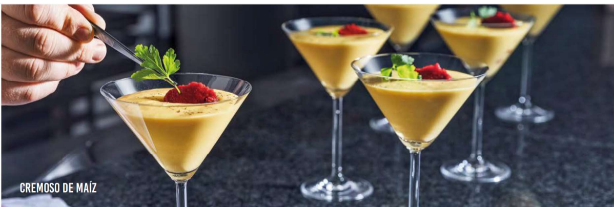
CREMOSO DE MAÍZ