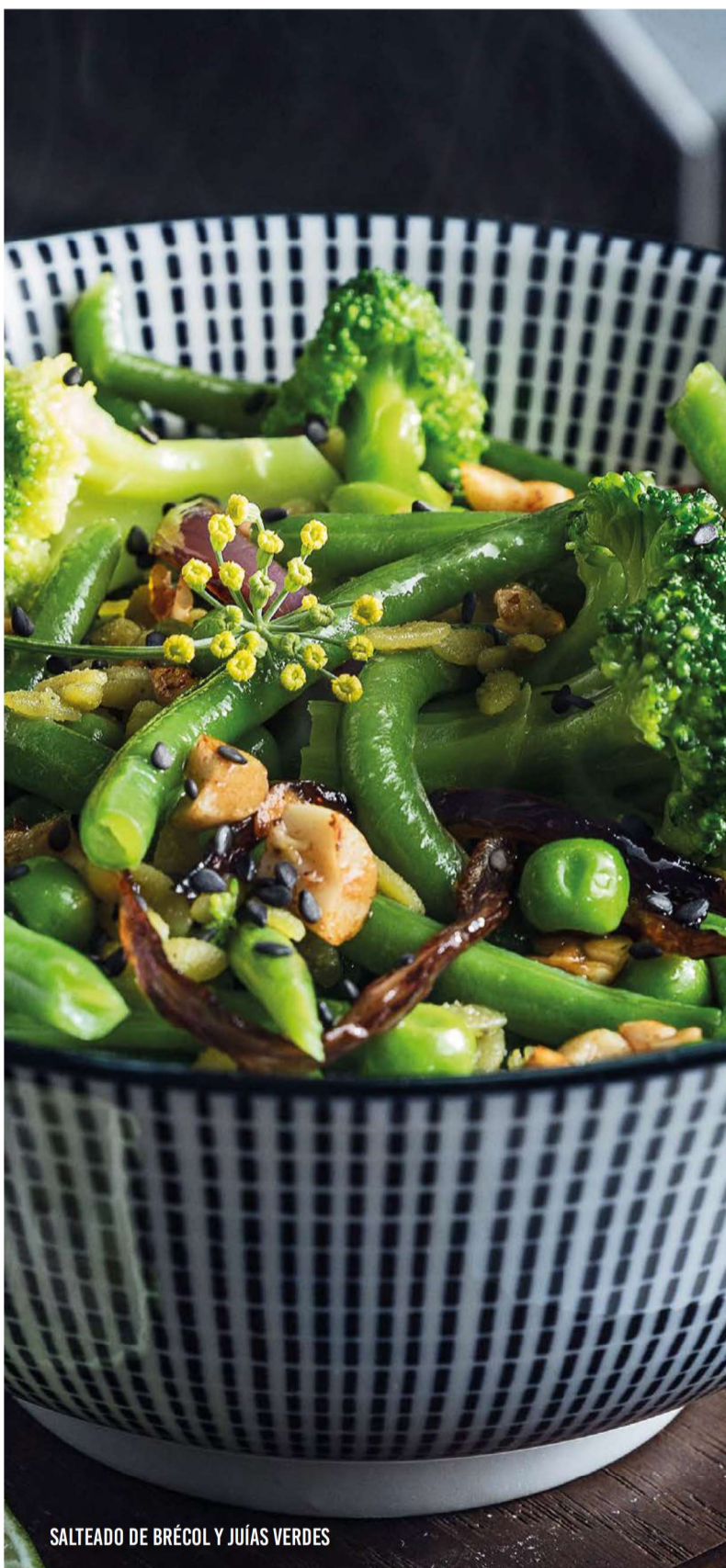
SALTEADO DE BRÉCOL Y JIJÍAS VERDES